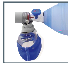
Válvula de paciente del Resucitador Ambu® Silicona Oval Plus Pediátrico.